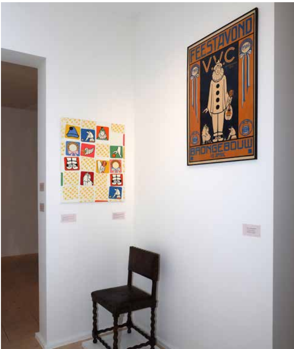
'PRACHTIGE TENTOONSTELLING VAN 200 JAAR KZOD.'

Met deze tentoonstelling, geopend op 23 oktober 2021, vierde het museum samen met de Haarlemse kunstenaarsvereniging Kunst Zij Ons Doel het 200-jarige bestaan van de vereniging. Voor deze tentoonstelling waren de leden uitgenodigd zich te laten inspireren door hun voorgangers. Hun werk, in combinatie met die van leden van vroeger, gaf een prachtig overzicht van de Haarlemse kunsttraditie van de negentiende eeuw tot aan nu.