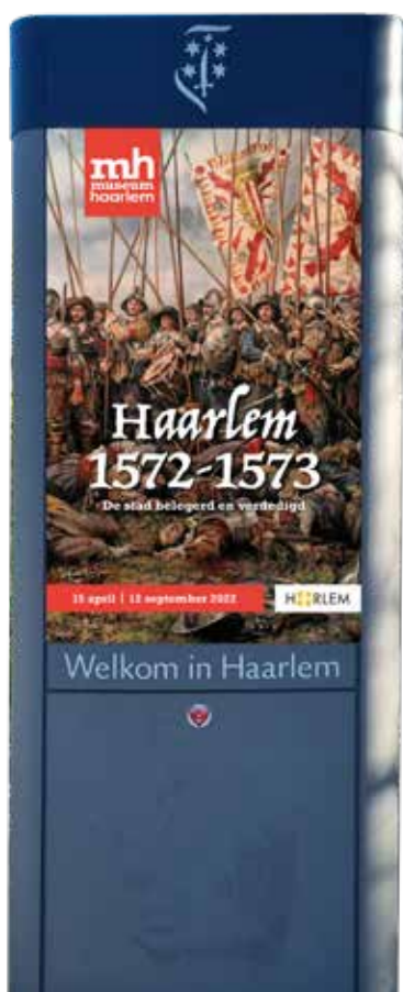
Tentoonstellingsposter op een digitale abri in Haarlem

'ZEER GOED GEDOCUMENTEERDE TENTOONSTELLING. HOGE KWALITEIT WAT BETREFT DE VORMGEVING. ZEER GENOTEN!'