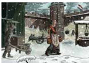
Beelden uit de animatiefilm 'Het Beleg van Haarlem' van Stefan de Groot