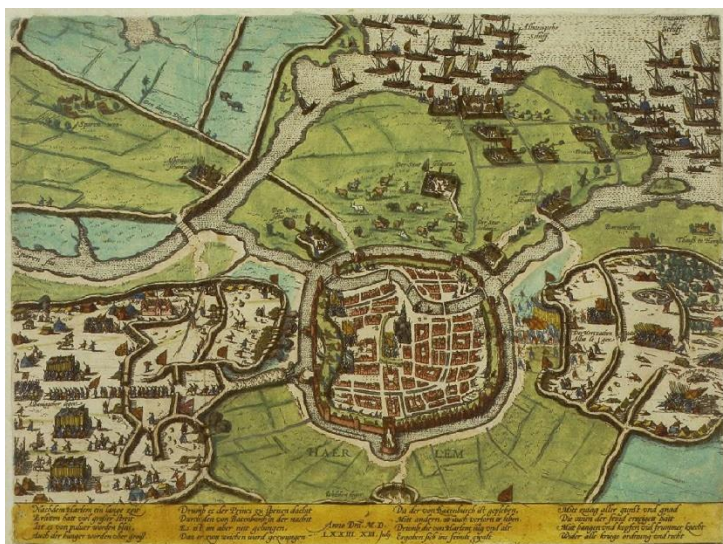
Frans Hogenberg - Haarlem en omgeving tijdens het Beleg door de Spanjaarden, kopergravure, 1573, Noord Hollands Archief