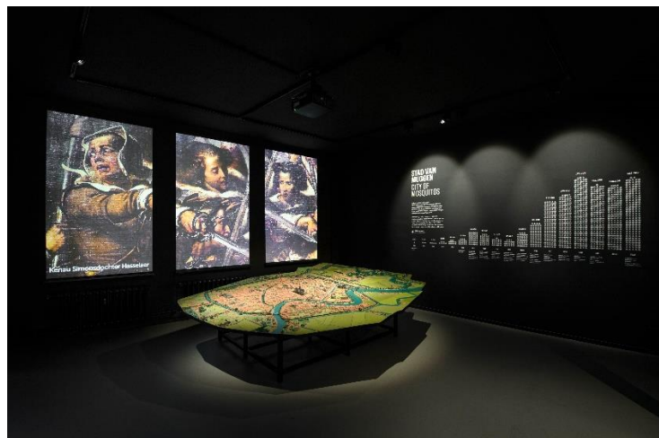
Haarlem 1572-1573 ook te zien in Allemaal Haarlemmers